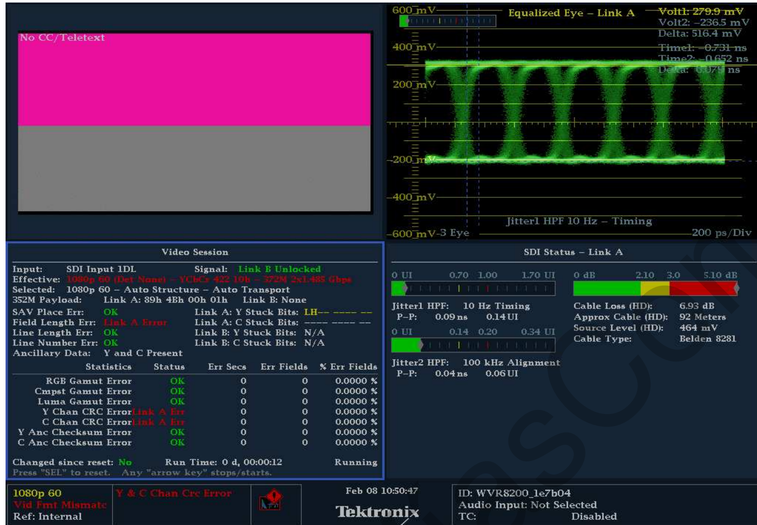
SMPTE 424m - 1,5 GHz / 3 Gbps - 150 metros